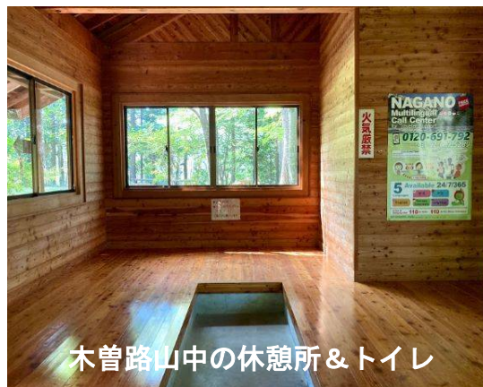
木曾路山中の休憩所&トイレ

「10月9日現在、お陰様でバスウォーク催行決定となりました。甲府W協会の方々の枠がありますので、当会会員の枠は後1名です。なお、現地集合の方の場合はこの限りではありません。又、台風等で公共交通機関が運行停止になった場合は催行延期となります。延期の場合は前日にHPで告知を致します。HPをご覧になれない方には電話でお知らせいたします。」・歩くコース：道の駅奈良井 10:15⇒奈良井宿⇒奈良井宿見学(現地ガイドを頼みました)⇒11:30 少し早いですが奈良井宿で昼食⇒奈良井宿出発 12:30⇒鳥居峠着 14:00(WC)⇒測候所跡 14:50(WC)⇒御鷹匠役所跡 15:20⇒蓼原宿 16:10⇒道の駅きそむら 16:20 バス乗車⇒各地へ(穴山駅 18:30 頃着予定)