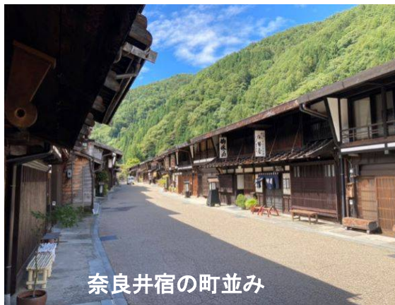
奈良井宿の町並み