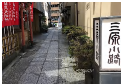
表通りのすぐ裏にある「三原小路」