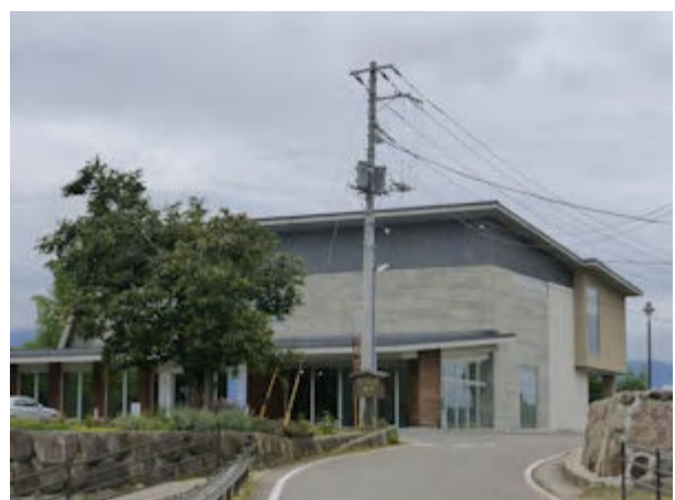
北杜市考古資料館