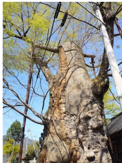
根古屋の大ケヤキ

第4回は、コースの前半においては、視界が大きく広がった明野町の上手より浅尾新田及び浅尾にかけて、茅ヶ岳西麓の丘陵地帯のウォーキングになります。