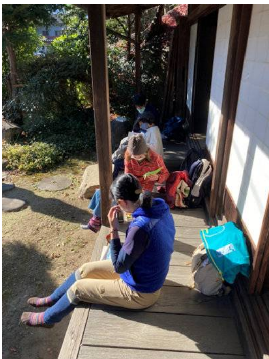
台原家の縁側でランチ

また、座敷一杯に展示されておりますので、お弁当は縁側か庭で、ということになりました。敷物を持参して下さい。