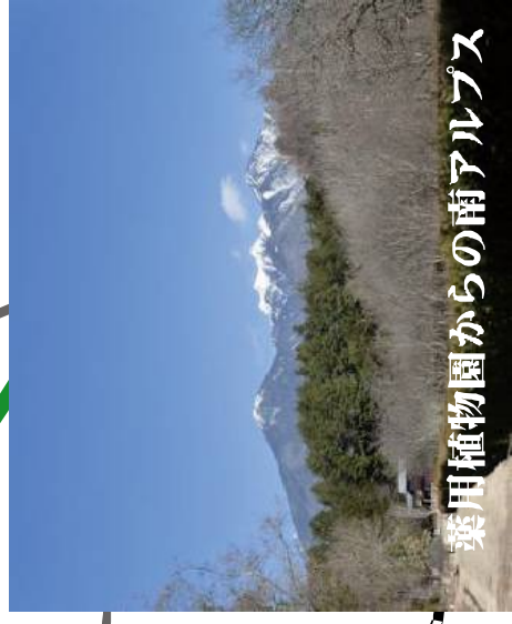
薬用植物園からの南アルプス